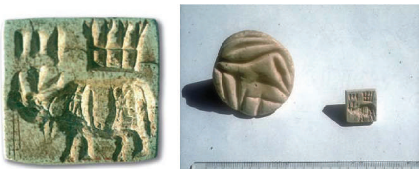
2 расм. Шўртўқай ёдгорлигидан топилган муҳрлар

Ёдгорликнинг иккинчи даври моддий маданиятида муҳрларнинг учрашини эътибордан чиқаришимиз мумкин эмас. Бу муҳрларда инсоннинг ҳайвонат дунёси билан қурашаётган тасвири ифодаланган бўлиб, бу тасвирларни ёдгорлик тадқиқотчиси Эламнинг тасвирий санъатдаги маданий таъсири деб баҳолайди. Демак, ложувард савдоси йўлида эламликларнинг бевосита иштироки моддий маданият намуналарида кузатилмоқда.