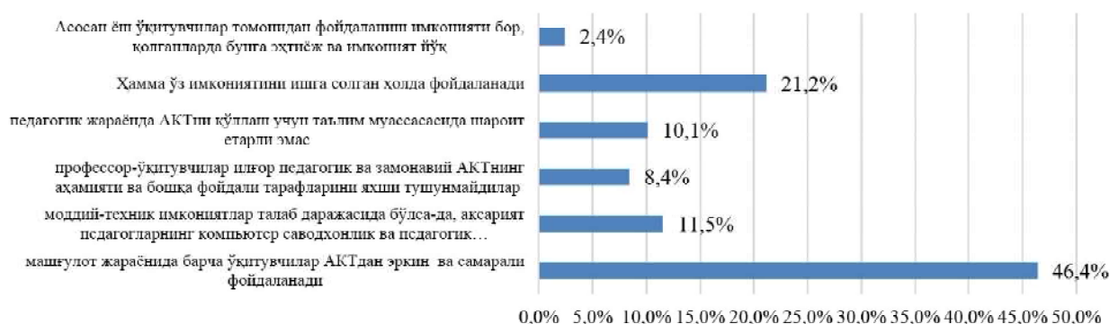
Бугунги кунда сиз фаолият юритаётган ОТМда профессор-ўқитувчиларнинг педагогик ва замонавий АКТдан фойдаланиш имкониятини қандай деб ўйлайсиз?

21,2 фоиз билан "ҳамма ўз имкониятини ишга солган ҳолда фойдаланади", деган жавоб ОТМларда илғор педагогик ва замонавий АКТларнинг фойдаланишнинг ҳамма учун мажбурий бўлган талаб ва меъёрлари мавжуд эмаслигини ва бу ҳолатнинг масъул раҳбарлар томонидан назорат қилинмаслигидан далолат беради. Таъкидлаш лозимки, бу ҳам олий таълим сифати ва самарадорлигини оширишга тўсиқ бўлаётган катта муаммолардан биридир. ОТМ профессор-ўқитувчиларнинг педагогик ва АКТлардан самарали фойдаланиш компетенциясининг етарли эмаслиги респондентларнинг 19,9 фоиз таъкидлаб турибди (4 ва 5-жавоблар).