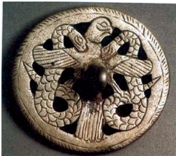
3-расм. Окс цивилизацияси муҳрларидан намуна.

Бақтрия ва Марғиёналиклар Марказий Осиёда глиптика соҳасига ҳам асос солган. Бронза даври глиптикаси муҳрларда, туморларда, мунчоқларда ифодаланган. Глиптика моддий маданият манбалари орасида энг кўп тарихий маълумотлар бериб, уларда ифодаланган тасвирлар бронза даври аҳолисининг санъати, мифологик ва диний дунёқарашлари, табиат манзаралари, ҳайвонот дунёси, бошқа халқлар билан маданий алоқалари, қадимги халқлар миграцияси каби маълумотларни беради.