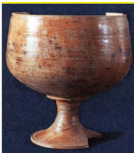
1- расм. Окс цивилизацияси кулолчилигидан намуна.

Марказий Осиёда нафақат кулолчилик чархи, балки икки ярусли хум-донларнинг кашф этилиши ҳам Олтинтепаликлар чекига тушган, у Олтинтепа аҳолисининг ижодий маҳсули натижасидир [25]. Сополли маданияти хумдонлари тарихини А.А. Асқаров ва У.В. Раҳмоновлар ўрганган. Хумдонлар типология қилинган, эволюцион ривожланиши ва такомиллашиб бориши кузатилган [5, 10; 6, 36-38; 7, 12-41; 36, 6-9].