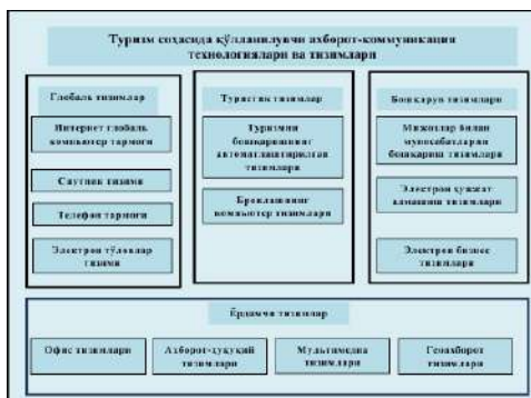
2-расм. Туризм соҳасида қўлланилувчи ахборот-коммуникация технологиялари ва тизимлари

Туризм соҳасини бошқариш ташкилотлари ва туристик фирмалар ўз ишида доимо ахборот технологияларини ўзлаштиришмуаммосига дуч келмоқда. Ахборот технологиялари-туризм бизнесининг халқаро интеграциясини ахборот билан тўйинган соҳаси сифатидаги зарурий шарт-шароитлари ҳисобланади. Ҳудуднинг туристик салоҳиятини тадқиқ этишда ва уларнинг дастурларини ишлаб чиқиш ҳамда ўзлаштиришда мутахассислар туризм дистрибуциянинг турли томонларини ифодаловчи кўпгина ахборотларга тўқнаш келмоқдалар.