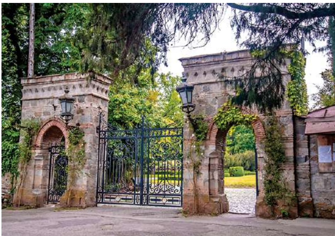
Рисунок 2. Главная входная дверь дворца Цинандали

Доисторические источники Цинандали впервые упоминаются в XV веке. Наши далекие предки систематически экспериментировали с вражескими нашествиями, люди были вынуждены покинуть бар на горных склонах или на берегах реки Алазани. Ни предшественник не представлял собой образцовое и много экспериментов.