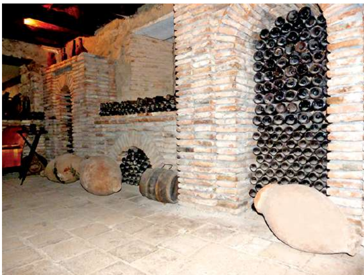
Рис. Винный погреб

С дальнейшим развитием администрация музея запланировала множество нововведений, которые позволят посетителю с нетерпением ждать прошлого и прекрасно представить события этого периода, открыть мир жителей дворца и понять их благосостояние. Будет хорошо, если у вас будут видеоматериалы и документальные фильмы, которые станут более понятными для жизни дворца.