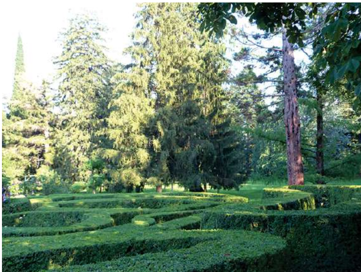
Рис. 3. Лабиринт

Мы должны поговорить о дендро-парке который окружен дворцом и представляет собой важный туристический ресурс. Существует множество редких сортов деревьев, фруктовых садов, цветков, виноградников, лабиринты вечнозеленых кустов, "любовная аллея", которые довольно популярны для посетителей.